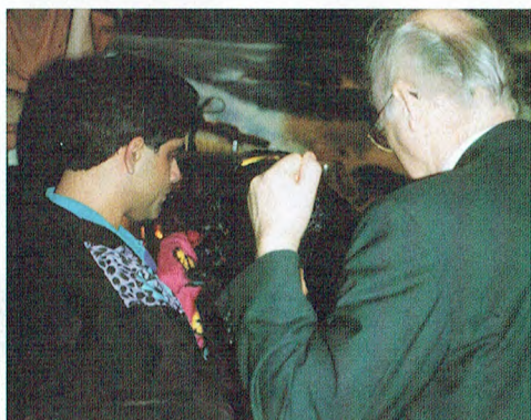
De bacterie wordt bestraft in de naam van Jezus Christus.