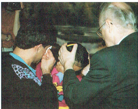
De handen worden haar opgelegd in Jezus' naam en kracht van God doorstroomde haar.

was niet te stoppen, niet te doden, en deed zijn verwoestend werk.